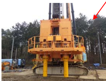
超硬質オーガー (高トルクインバータモータ)